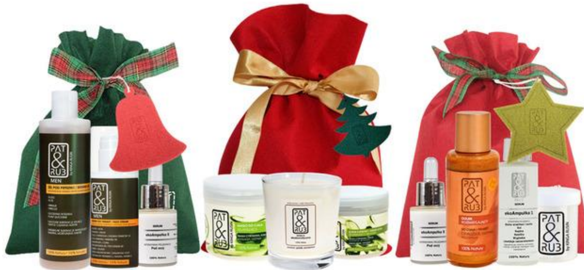
Woreczek z wstążką i ozdobą